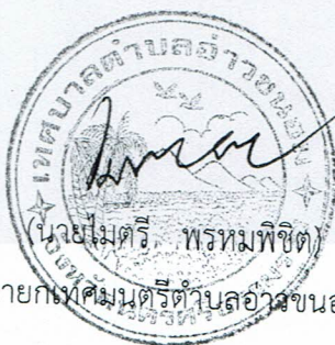
นายกเทศมนตรีตำบลอ่าวขนอม