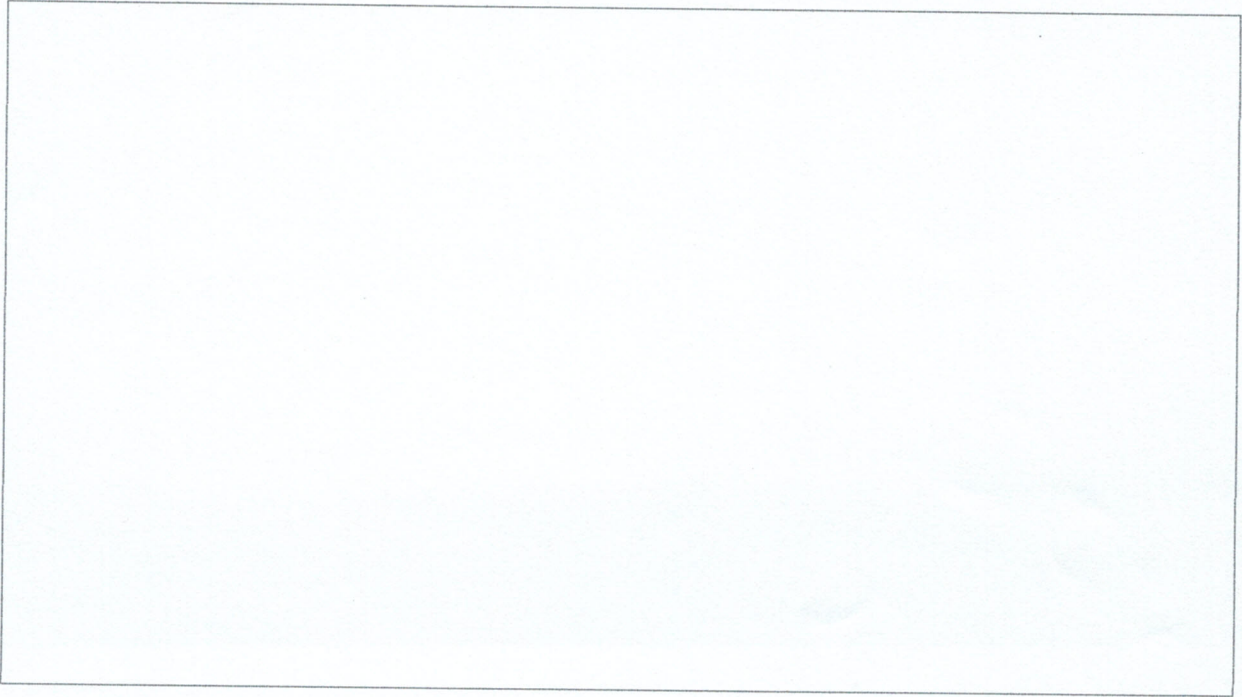
แผนที่แสดงที่อยู่อาศัย