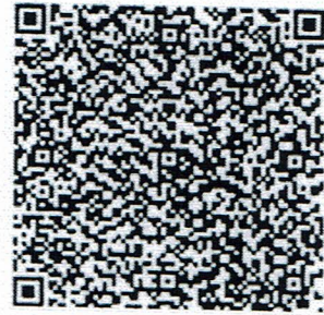
เด็กดีของแผ่นดิน