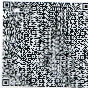
ศึกษานิเทศก์ดีของแผ่นดิน